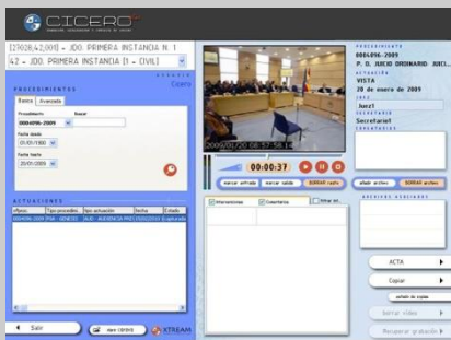
Fig. 3: Interfaz de consulta de la vista oral

CICERO es la solución integral que gestiona de forma global la grabación, catalogación y distribución de los Juicios Orales celebrados en las salas de vistas de los tribunales, comparencias, etc.