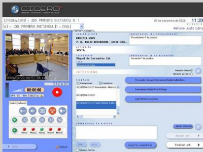
Fig. 2: Interfaz de grabación y catalogación de la vista oral